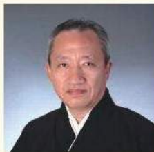
桐竹勸十郎 文案人形遣い