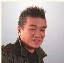
BORO シンガーソングライター