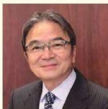
宮田亮平 文化庁長官 — 基調講演 —